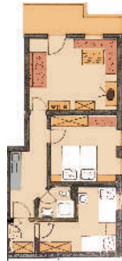
2. Stock Süd

2 - 4 Personen, ca. 60 qm (9) 3-Raum-Wohnung, 2 Stock mit Südbalkon, Geschirrspüler, Mikro Heißbluttherd und gr. Cerankochfeld, zusätzl. Couch für 2 Personen