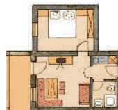
1. Stock West

2 Personen, ca. 33 qm (6) zusätzl. Couch, Mikro für 2 Personen