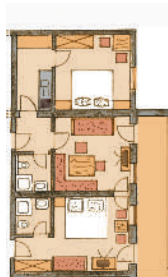
1. Stock Ost

2 - 4 Personen, ca. 65 qm (1) 3-Raum-Wohnung mit zwei Schlafzimmern u. 2x DU/WC, Geschirrspüler, Mikro und gr. Cerankochfeld, 2 TV Vermietung ab 6 Tage