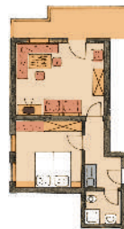
2. Stock Süd

2 Personen, ca. 43 qm (7) 2 Stock mit Südbalkon, Geschirrspüler, Mikro und gr. Cerankochfeld zusätzl. Couch für 2 Personen